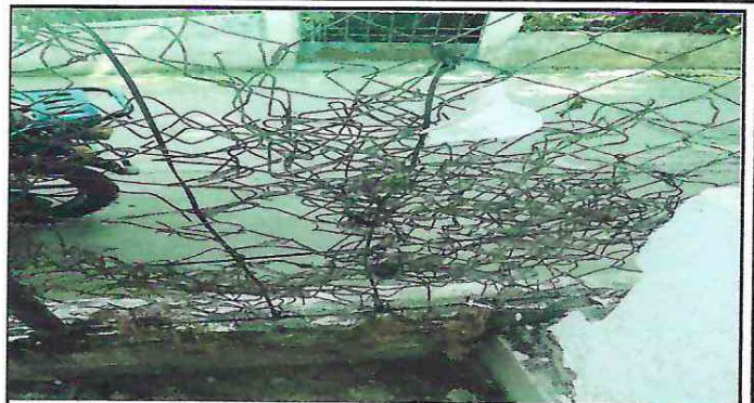
Foto 2: Espacios de muro perimetral cubiertos con pedazos de malla en mal estado